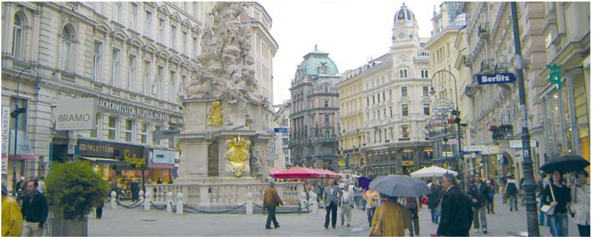
Los diferentes proyectos debían mostrar un plan de rehabilitación de un área reprimida de Viena que la volviera a convertir en comercial. / L. R.