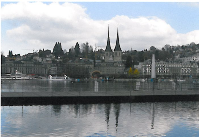
Jazero a mesto Luzern, pohľad od Kultúrneho a kongresového centra