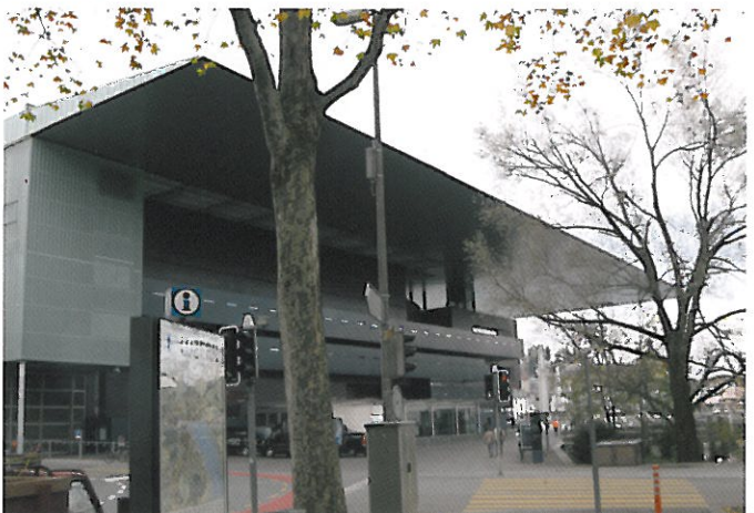
Kultúrne a kongresové centrum, Luzern (arcitektúra: Jean Nouvel)